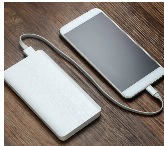
Аккумулятор для мобильного телефона