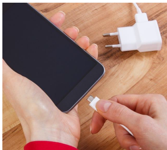
Зарядка мобильного телефона